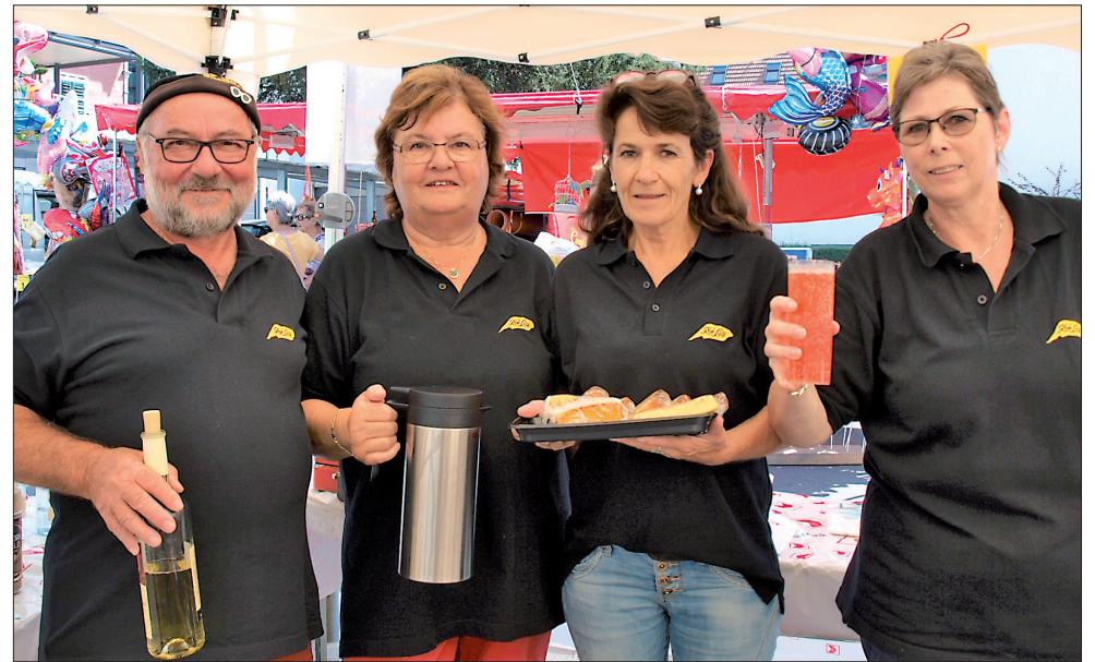
Das Festbeizli der Maskengruppe Rigi Lüt Küssnacht war sehr gut frequentiert.